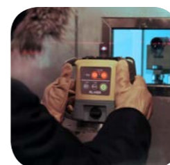
恒温恒湿試験・低温試験

現場で使用する機械は信頼性が第一と、トプコンは考えます。そこで、製品を安心して長期間お使いいただけるよう、過酷な現場を想定した耐環境試験を実施しています。RL-H5A は、専用の検査装置により防塵・防水性能を徹底検証するだけでなく、振動・落下・温度・湿度など多岐にわたる試験をクリア。トプコンのローテーションレーザー史上、最高レベルの耐久性を実現しています。