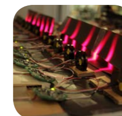
レーザー耐久試験